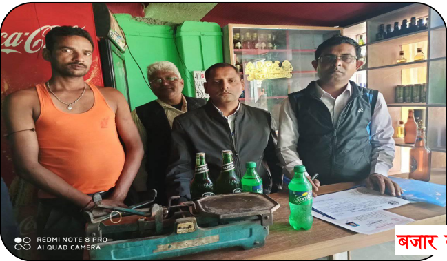
बजार तथा क्वारेन्टीन अनुगमन