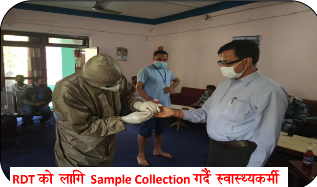
RDТ को लागि Sample Collection गर्दै स्वास्थ्यकर्मी