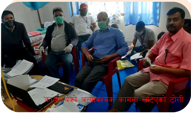
कार्यालयको अत्यावश्यक काममा खटिएको टोली