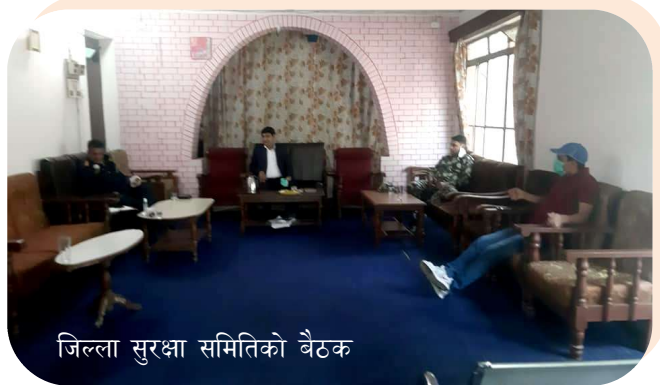
जिल्ला सुरक्षा समितिको बैठक