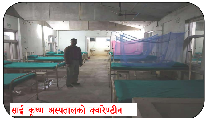
साई कृष्ण अस्पतालको क्वारेन्टीन