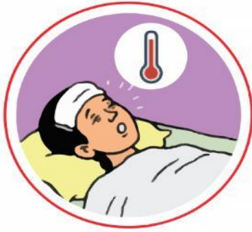
ज्वरो आउने (१००.४°F भन्दा माथि)