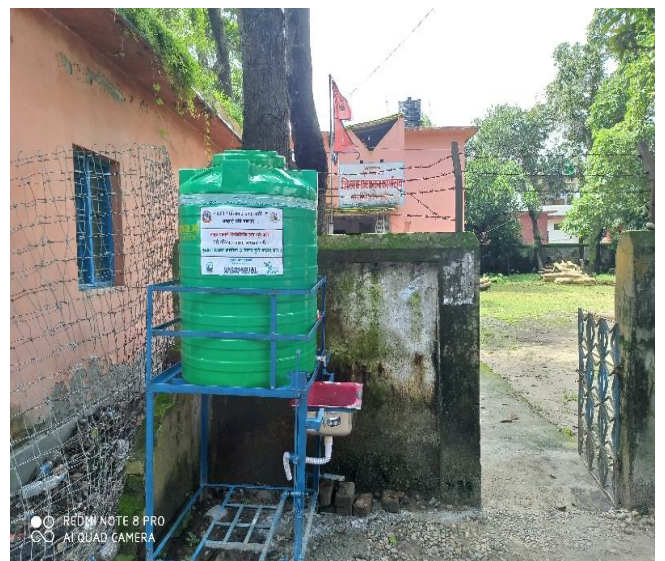
कोभिड १९ रोकथामका लागि सेवाग्राहीहरूका लागि हात धुने स्थान जि प्रशासन कार्यालय समरी