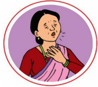
श्वास फेर्न गाह्रो हुने

यस्ता लक्षणहरू देखा परेमा नजिकको तोकिएको स्वास्थ्य केन्द्रमा सम्पर्क गर्नुहोस्।