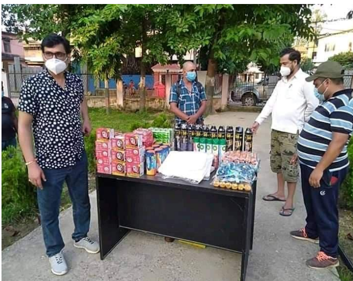
आईसोलेशनको लागि सरसफाई तथा अन्य सामग्री सहयोग