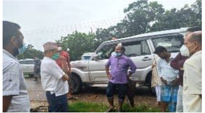
प्रदेश मुख्यमन्त्रि तथा सामाजिक विकास मन्त्रालयबाट सप्तरी जिल्लाको कोभिड १९ संक्रमण तथा विपद् व्यवस्थापनको लागि आवश्यक छलफल तथा अनुगमन र थप सुधारका लागि छलफल गर्दै